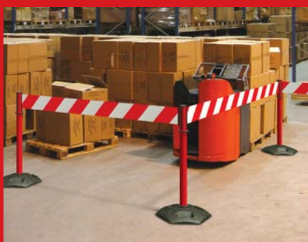
Zábrany se samonavíjecím pásmem