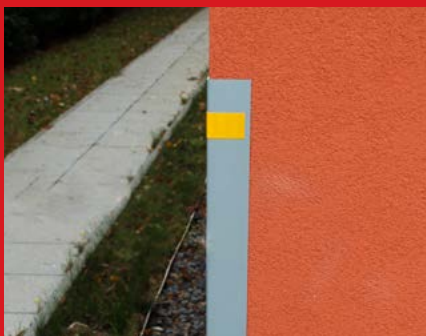
Slim PVC 65 na zateplené fasády