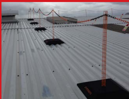
Střešní mobilní zábrany