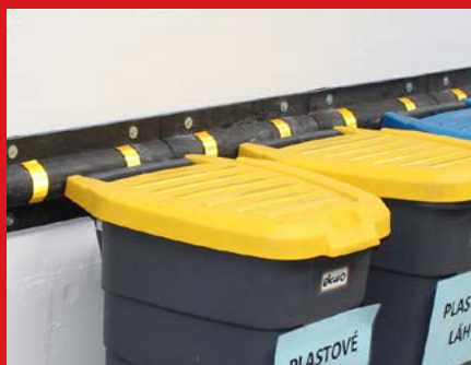
Economic z recyklované gumy