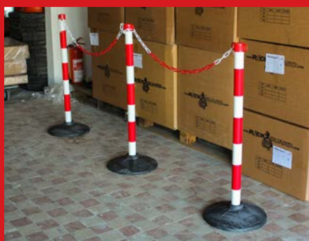
Sloupky s plastovým řetězem