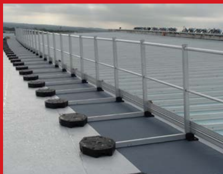
Střešní zábrany pro kolektivní ochranu